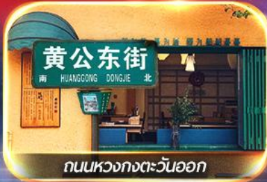
ถนนหลวงทางตะวันออก