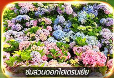
ชมสวนดอกไฮเดรนเจีย