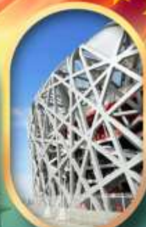
ผ่านชมสนามกีฬาโอลิมปิก