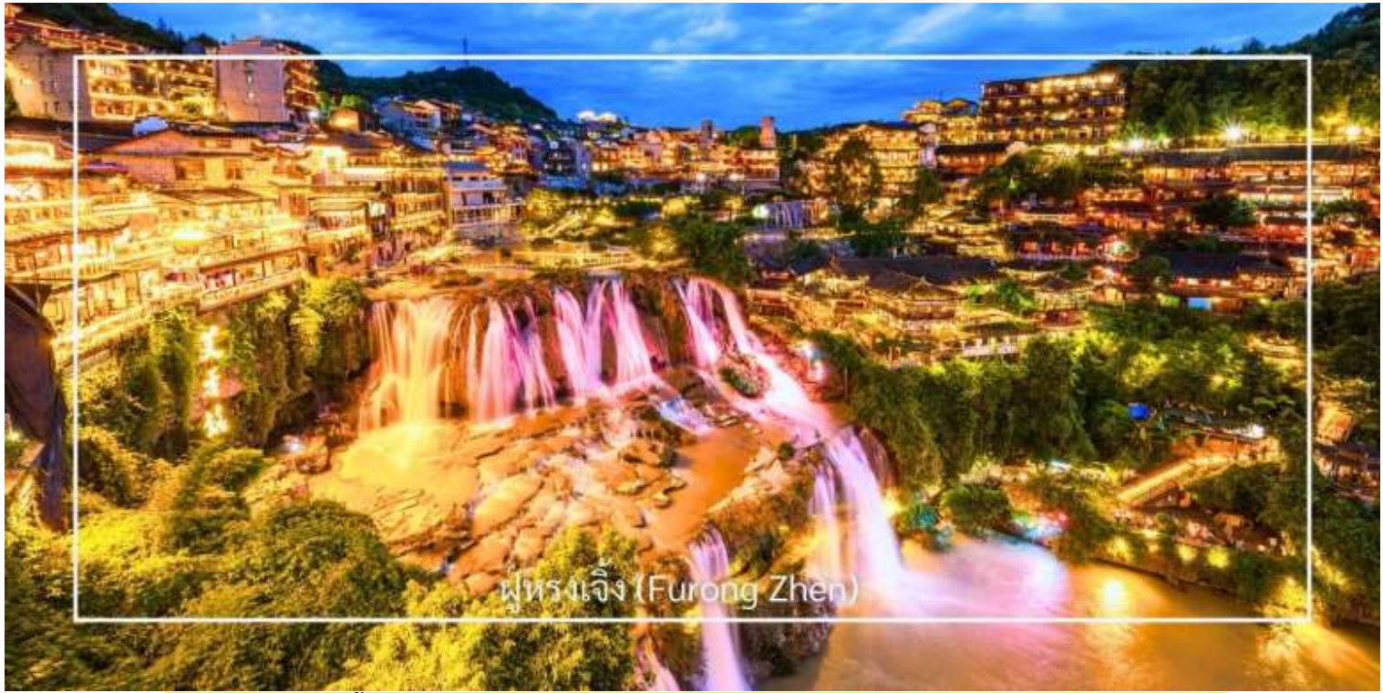
ฟูรงเจิ้ง (Furong Zhen)

ท่านสามารถเลือกซื้อบริการเสริม (Option) เพิ่มเติมได้: สะพานกระจกแกรนด์แคนยอน 400 หยวน/ท่าน สัมผัสประสบการณ์สุดตื่นเต้นกับการเดินบนสะพานกระจกใส ที่ทอดยาวเหนือหุบเขาสูง ให้ท่านได้ชมทัศนียภาพอันงดงาม แบบพาโนรามา พร้อมท้าทายความกล้าท่ามกลางบรรยากาศธรรมชาติอันยิ่งใหญ่