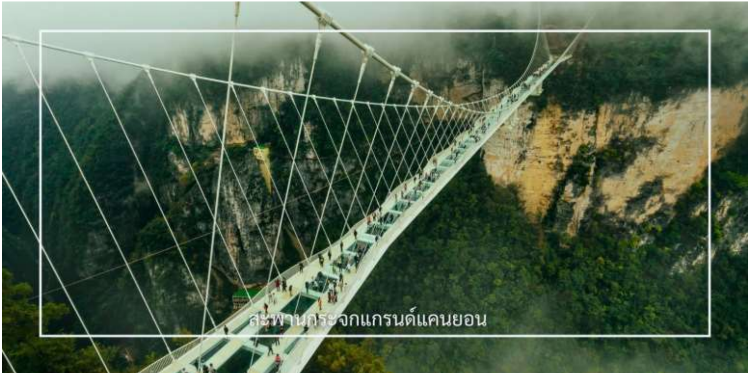
สะพานกระจกแกรนด์แคนยอน

ท่านสามารถเลือกซื้อบริการเสริม (Option) เพิ่มเติมได้: สะพานกระจกแกรนด์แคนยอน 400 หยวน/ท่าน สัมผัสประสบการณ์สุดตื่นเต้นกับการเดินบนสะพานกระจกใส ที่ทอดยาวเหนือหุบเขาสูง ให้ท่านได้ชมทัศนียภาพอันงดงาม แบบพาโนรามา พร้อมท้าทายความกล้าท่ามกลางบรรยากาศธรรมชาติอันยิ่งใหญ่