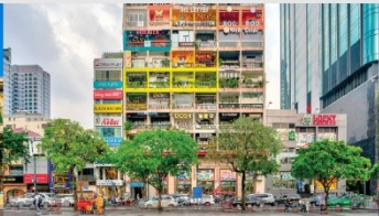
คาเฟ่ อพาร์ทเม้น