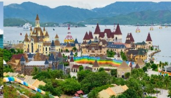
สวนสนุกวันเดอร์ส

*ทางบริษัทฯ ขอสงวนสิทธิ์ในการสลับโปรแกรมทัวร์ตามความเหมาะสมขึ้นอยู่กับสถานการณ์หน้างาน โดยคำนึงถึงผลประโยชน์ของลูกค้าเป็นสำคัญ