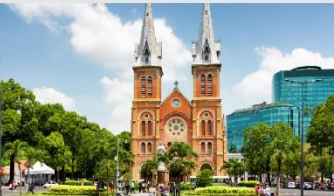
โบสถ์นอร์ทเทรอดาม