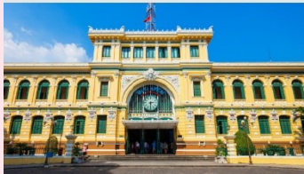
ไพรบงยีกกลางโฮจิมินห์