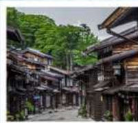
หมู่บ้านโบราณนารายิ จุกุ