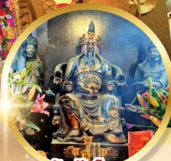
วัดปึกโต

เสริมโชคลาภนำความรุ่งเรือง ทุกด้านของชีวิต