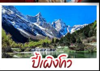
ปี้เฉิงโกว