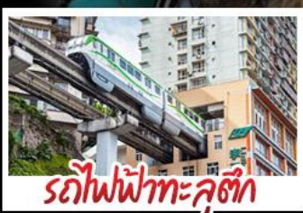
รถไฟทะเลลุดัก