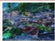
หมู่บ้านแม่วชิเจียง