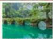
อุทยานเสี้ยวซือจง