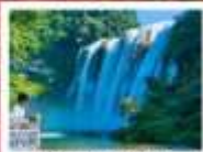
น้ำตกหวงทิวซู