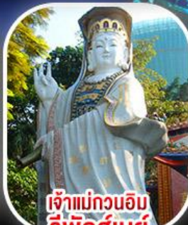
เจ้าแม่กวนอิม รีพัสลีย์