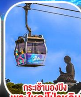
กระเช้าเองปีง พระใหญ่โป่วหลิน