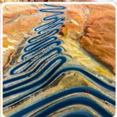
ถนนผานหลงกู่ดาว