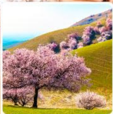
ทุ่งดอกอัลมอนด์