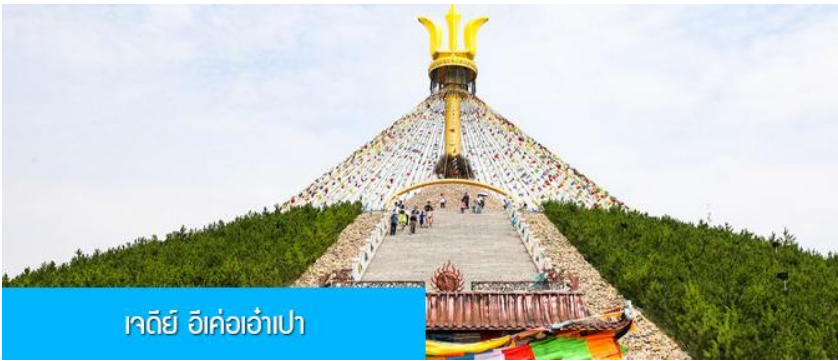
เจดีย์ อี้เค่อเอ้าเป่า

พักที่ DALAETQI SHNAGJING HOTEL โรงแรมระดับ 4 ดาวหรือเทียบเท่าในเมืองด่าลาเท่อ