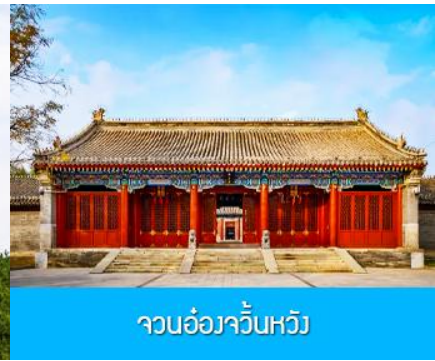
จวนอ๋องจวินหวัง

วันที่หก เมืองเออร์ดอส-อี้เค่อเอ้าเป่า-จวนอ๋องจวินหวัง- สวนวัฒนธรรมหมงกู่หยวนหลิว-ซื้อปิ้งถนคนเดิน