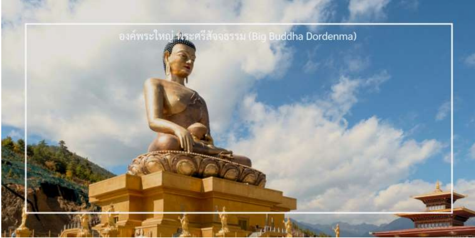
องค์พระใหญ่ พระศรีสัจธรรม (Big Buddha Dordenma)

เที่ยวชม องค์พระใหญ่ พระศรีสัจธรรม (Big Buddha Dordenma) เป็นพระพุทธรูปที่มีความสูงถึง 51 เมตร ตั้งอยู่บนยอดเขาในเมืองทิมพู (Thimphu) ประเทศภูฏาน พระพุทธรูปนี้เป็นหนึ่งในพระพุทธรูปที่ใหญ่ที่สุดในโลก