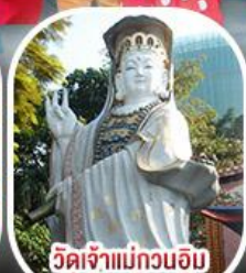
วัดเจ้าแม่กวนอิมรีพัลส์เบย์