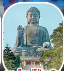
พระใหญ่โป่วหลิน