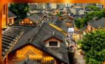
เมืองโบราณสี่ปาตี