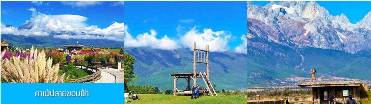
คาเฟ่ปลายขอบฟ้า

เที่ยง รับประทานอาหารกลางวัน ณ ภัตตาคาร (2)