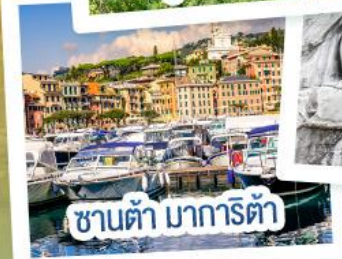
ซานต้า มารีตา