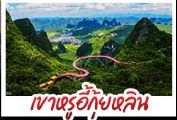
เขาเขรุ้อกุ้ยหลิน