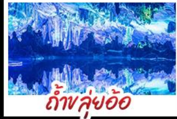
ถ้ำลุย้อ