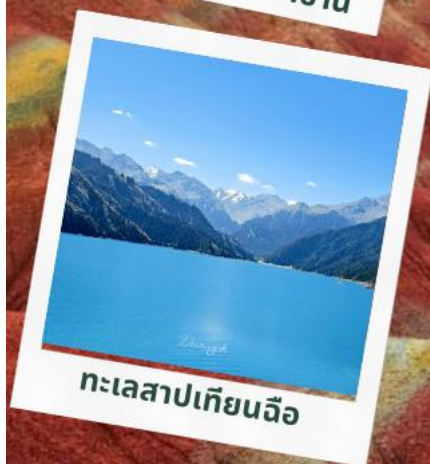
ทะเลสาปเทียนฉือ