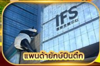
แพนด้ายักษ์ปิ่นตึก