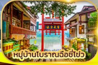
หมู่บ้านโบราณฉือชี่ไป๋