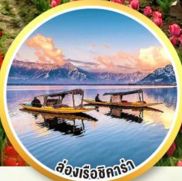
ล่องเรือชิคร่า