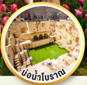
บ่อน้ำโบราณ