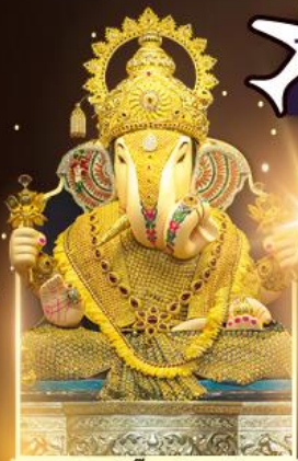
องค์ตั้งบูทพิเศษ