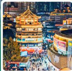
ตลาดตงเหมิน

• โฮเทล OH Bay เป็นแลนด์มาร์คท่องเที่ยวและศูนย์การค้าทันสมัยริมทะเล กวนอูในเซินเจิ้น ขึ้นชื่อเรื่องการขอพร โชคลาภ บารมี ความสำเร็จในการทำงาน