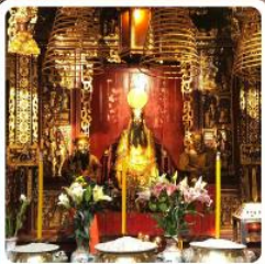
วัดกวนอู