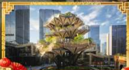
XIAN TREE&MIXC MALL