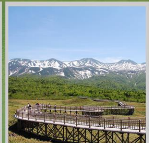
“SHIRETOKO 5 LAKES”