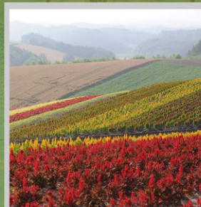
“SHIKISAI NO OKA”