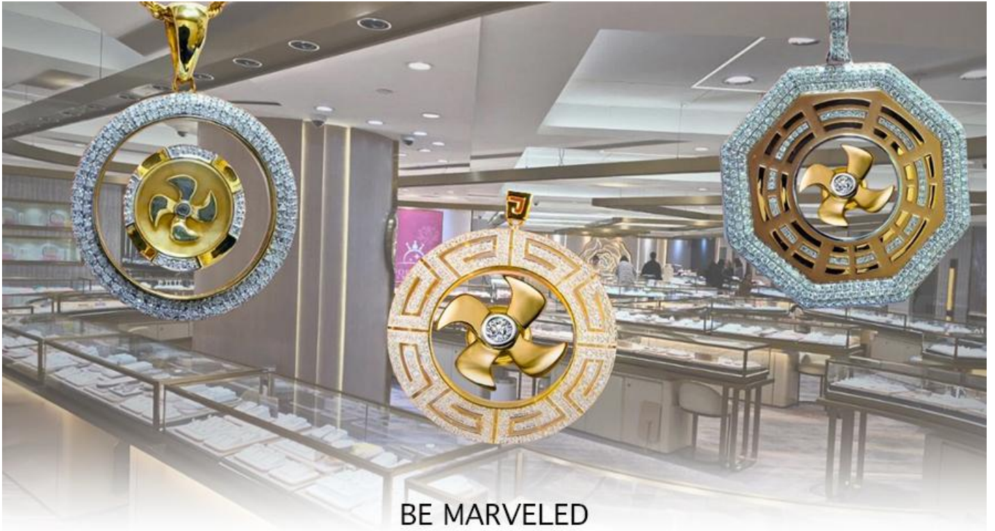
BE MARVELED ศูนย์ฮวงจุ้ย กัมพันนครบุรี

นำท่านชม ศูนย์ปีเจียะ ซึ่งคนจีนนับถือว่าหยกเป็นหิน ที่เป็นตัวแทนของความสวยงามและความบริสุทธิ์มีความเชื่อว่า หยก มงคล ถ้าพกติดตัวไว้จะอายุยืนและสุขภาพดีมีสินค้าน่ามากมายเกี่ยวกับหยก อาทิ กำไลหยก หรือสัตว์นำโชคอย่างปี เจียะ ให้ ท่านได้เลือกซื้อเป็นของฝาก, ของที่ระลึก หรือของนำโชคแต่ตัวท่านเอง