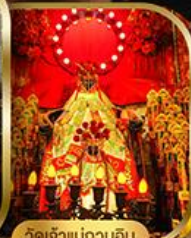
วัดเจ้าแม่กวนอิม ฮองอ่า