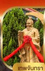
เทพจันทร่า

พิเศษฟรี! ลงห้องลับหวังต้าเซียน รวมกระเช้าฮ่องกง