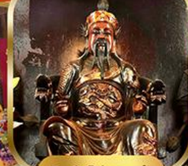
วัดบิกไต้ ฮองอ่า