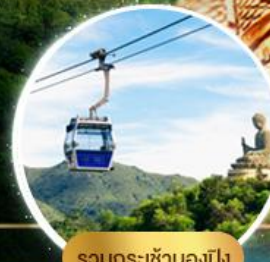
รวมกระเช้าฮ่องกง