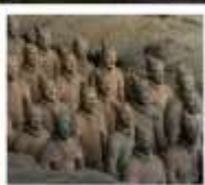
พิพิธภัณฑสถานภัคดี