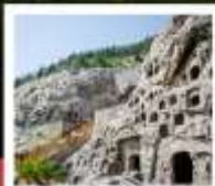
ท่าหลงเหมิน

ตลาดกลางไคเฟิง / ศาลไคเฟิง / ประตูเมืองท่าต้าเหลียนเหมิน / สวนชิงหิงซึ่งเหอ อุทยานหยุนโกซาน / วัดเล่าหลิน / ป่าเจดีย์ / โชว์วิถียาพุทธเล่าหลิน / โชว์ SHAOLIN MUSIC CEREMONY ท่าหลงเหมิน / ชมดอกโบตั๋น / ถนนคนเดินสี่จั๊งเหมิน / เมืองโบราณลั่วอี้ (ฟรีใส่ชุดพื้นเมืองชาวฮั่น) กำแพงเมืองอิ่งเกียนเหมิน / พิพิธภัณฑสถานภัคดีอาหารม้าเจิ้นซี / โชว์ราชวงศ์ถัง / กำแพงเมืองโบราณซื่ออัน จัตุรัสหอรบะมิง + หอกลอง / ตลาดมุสลิม / JOY CITY / เจดีย์ห่านป่าใหญ่ / ถนนคนเดินวัฒนธรรมต้าถ้ง