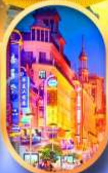
ถนนหนานกิง