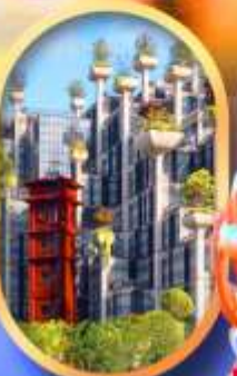
อาคาร 1,000 คัดไม้