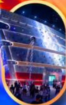
เรือเดอะหลุยส์