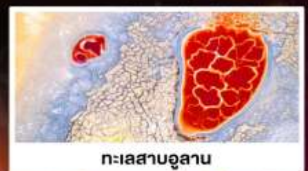
ทะเลสาบอูลาน