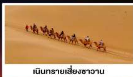
เป็นทรายเสี่ยงชาวน