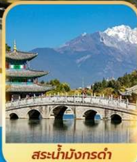
สะพานมิ่งกรต้า