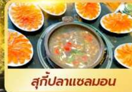
สุกัปลาแซลมอน