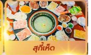
สุกัเห็ด