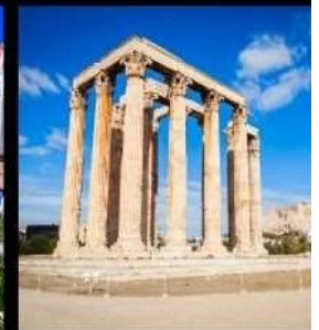
Temple Of Olympian