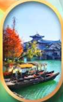
เมืองโบราณผู้หยวน