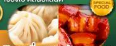
พิเศษ เสี่ยวหลงเป่า หมูแดงพอ เดินทาง ม.ค. - มิ.ย. 69