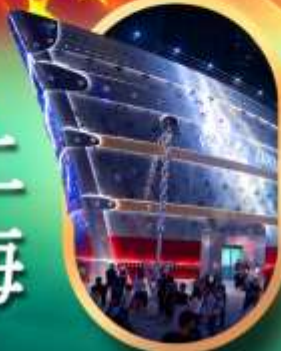
เรือคองหลุยส์