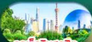
จุดเช็กอินสุดฮิต North Bund Shanghai

เซี่ยงไฮ้ หางโจว ล่องทะเลสาบซีหู ฟรีคีย์