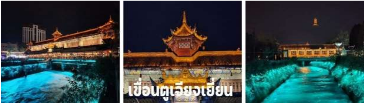
ที่พัก LIWAN HOLIDAY HOTEL DUJIANGYAN หรือเทียบเท่า 4 ดาวจีน

จากนั้นชม เขื่อนตูเจียงเยี่ยน Dujiangyan 都江堰 สถานที่ท่องเที่ยวระดับ 5A ซึ่งโครงการชลประทานเขื่อนตูเจียงเยี่ยน (都江堰) ที่เมืองตูเจียงเยี่ยน มณฑลเสฉวน ซึ่งได้รับการยกย่องให้เป็นมรดกโลกจากองค์การยูเนสโกเมื่อปี พ.ศ.2542 อธิระให้ท่านได้เก็บภาพความประทับใจ แสงสียามค่ำคืน