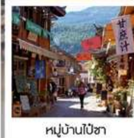
หมู่บ้านป๋อซา