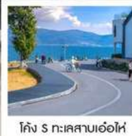
โค้ง S ทะเลสาบเอ๋อไห่

“นั่งรถไฟชมวิวภูเขาหิมะมังกรหยก” สุดพิเศษ คาเฟ่ YUN DI AN ฟรี!! เครื่องดื่ม ท่านละ 1 แก้ว