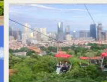
กระเช้าชมเมือง