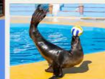
POLAR OCEAN PARK