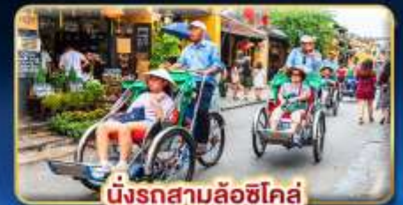
นั่งรถสามล้อฮิโค่