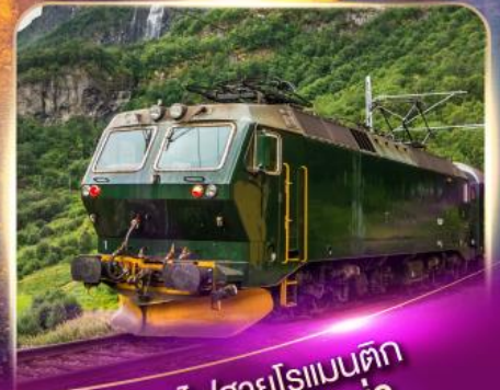
รถไฟสายโรเมนติก ฟลัมส์บาน่า