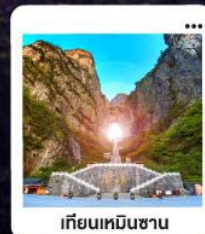
เกียนเหมินซาน