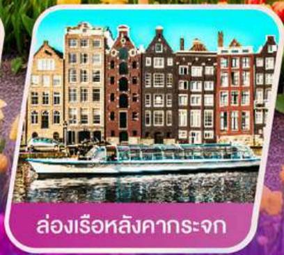
ล่องเรือหลังคากระຈก