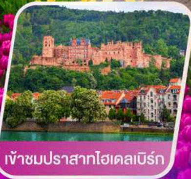
เข้าชมปราสาทไฮเดลเบิร์ก