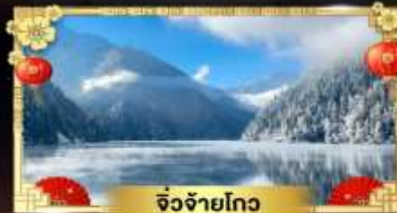
จี๋จ้ายโกว